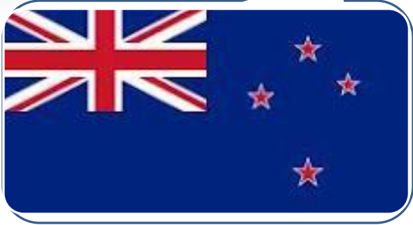
(NEW ZEALAND) SEJAK TAHUN KEWANGAN 1992