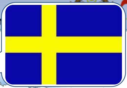
(SWEDEN) SEJAK TAHUN KEWANGAN 1994