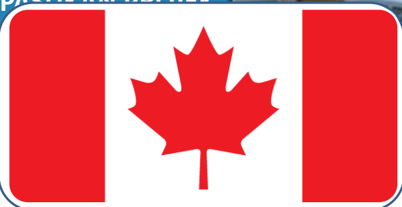
(KANADA) SEJAK TAHUN KEWANGAN 2002