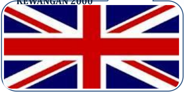
(U.K) SEJAK TAHUN KEWANGAN 2000