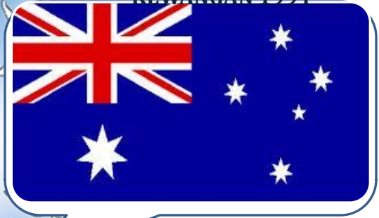
(AUSTRALIA)- SEJAK TAHUN KEWANGAN 1995

NEGARA YANG TELAH LAKSANA PERAKAUNAN AKRUAN